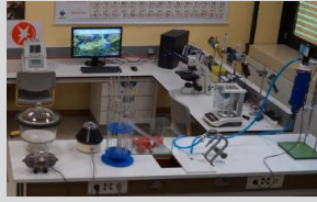
Mikroskope für den Nawi-Unterricht