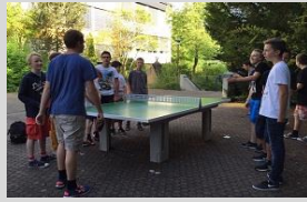
Tischtennisplatten für den Schulhof