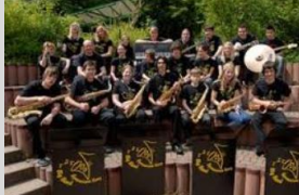
Unterstützung der Schulorchester