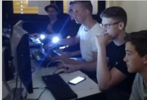
Musikanlage für die Technik-AG